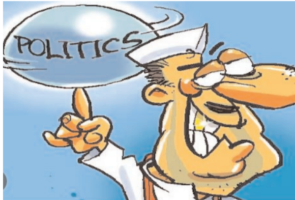
సామాన్యులకు రక్షణ ఎలా ఉంటుంది అర్థం చేసుకోవచ్చు.

2023 నవంబర్ డిసెంబర్ మాసాలలో జరిగిన తెలంగాణ, మధ్యప్రదేశ్, రాజస్థాన్, ఛత్తీస్ గఢ్, మిజోరాం శాసనసభ ఎన్నికలను స్వేచ్ఛాయుత వాతావరణంలో పూర్తిచేసేందుకు ఎన్నికల సంఘం కట్టుబడి ఉన్నట్లు ప్రకటించి ఎన్నికల బరిలో దిగేవారు తమ నేర చరిత్రను పత్రికా ప్రకటనల ద్వారా ప్రజలకు తెలియజేసి ప్రజల సమక్షంలో అంగీకరించాలని కేంద్ర ఎన్నికల ప్రధాన కమిషనర్ రాజీవ్ కుమార్ చేసిన హెచ్చరికను సభ్యులు పాటించినట్లు అనివచలేదు. నేరస్తులు, నేరం ఆరోపించబడిన వారిని చట్టసభల్లో సభ్యులుగా రాజకీయ పార్టీలు ఎంపిక చేస్తున్న సందర్భంలో వారి ఎంపికకు గల కారణాలను రాజకీయ పార్టీలు బాధ్యతాయుతంగా వెల్లడించాలని కూడా ఎన్నికల సంఘం చేసిన ఏ సూచన కూడా పార్టీలు అమలు చేయలేదు.