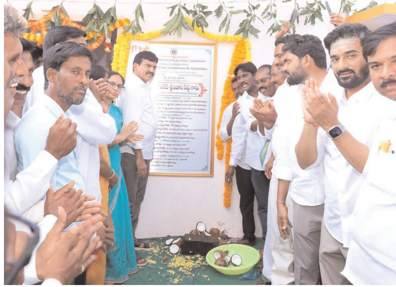
• ప్రజలకు మెరుగైన వైద్య సేవలు అందించాలి • రూ.60లక్షలతో పలు అభివృద్ధి పనులు ప్రారంభించిన మంత్రి