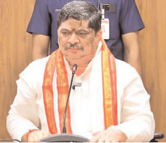
అన్నారు. జీహెచ్ఎంసీ రివ్యూ మీటింగ్ ఆనంతరం మంత్రి మీడియాతో మాట్లాడుతూ.. జీహెచ్ఎంసీ అభివృద్ధిపై ప్రభుత్వం సానుకూలంగా మిగతాది 2లో