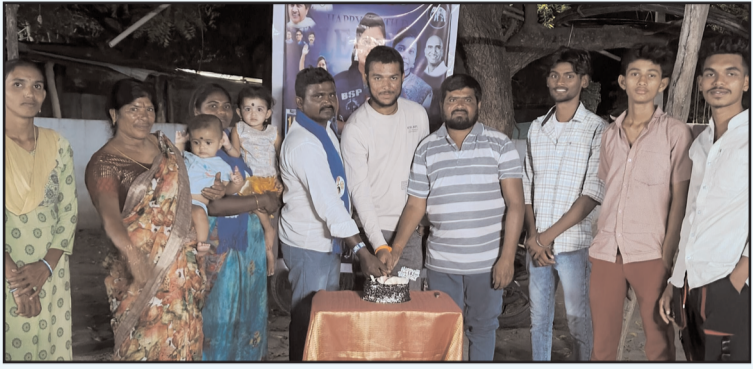
తరంగాలు - మరిపెడ

-డోర్నకల్ నియోజకవర్గ మహిళ కన్వెన్షన్ జనక సువార్త