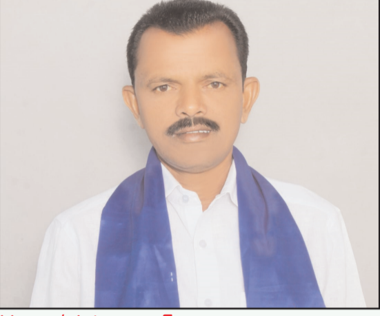
తరంగాలు/ మహబూబాబాద్ భారత రాజ్యాంగం నిర్మాత భారతరత్న చిన్న రాష్ట్రాల ప్రదాత డాక్టర్ బి.ఆర్. అంబేద్కర్ గారి జయంతి 14 ఏప్రిల్ రోజున