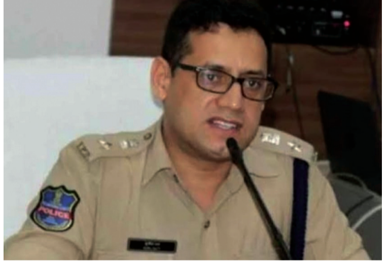
తరంగాలు/ఖమ్మం జిల్లా బ్యారో ఖమ్మం హెబాలీ సందర్భంగా ఖమ్మం పోలీస్ కమిషనరేట్ పరిధిలో సిటి పోలీస్ యాక్ట్ ఆంక్షలు