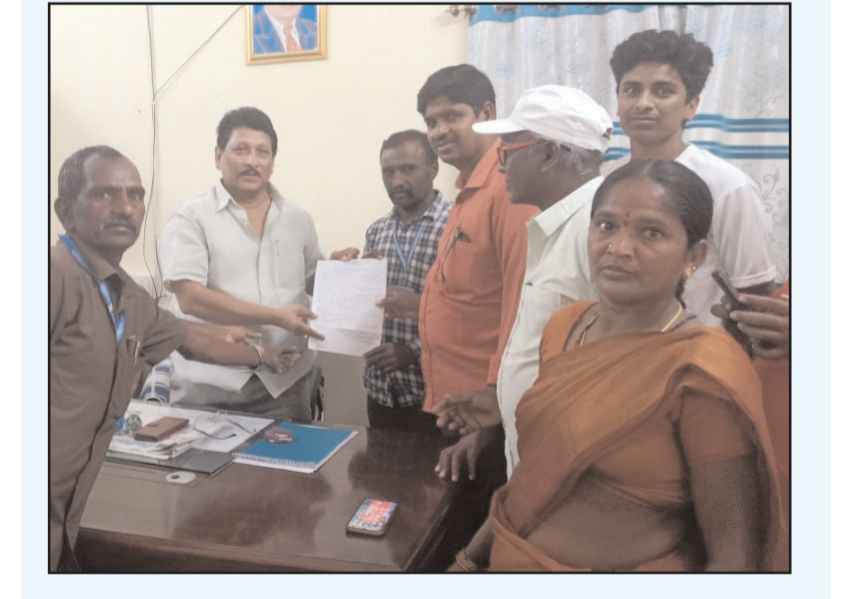
తరంగాలు సూన్స్ తొర్రూర్...