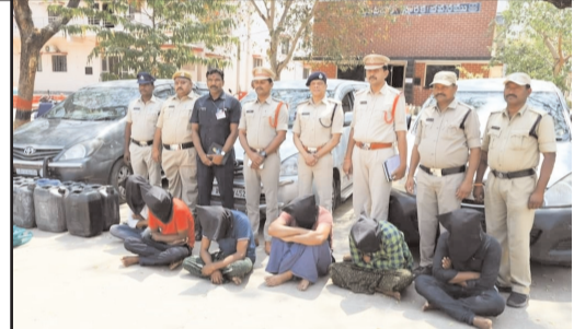
సీతారాంపురం తండా గ్రామం, బోల్లపల్లి మండలం, పల్నాడు జిల్లా.