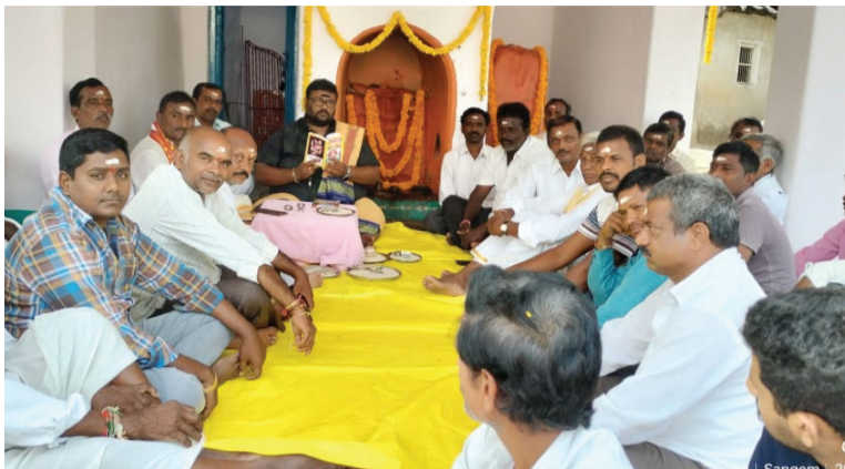
ఉగాదిగా మారినదని తెలిపారు. హిందూ గ్రంథాల ప్రకారం చూస్తే యుగాధి పండుగని పంతులుగారు తదితరులు పాల్గొనడం జరిగింది.