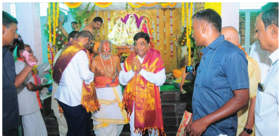
తరంగాలు/ఖమ్మం జిల్లా బ్యారో ఖమ్మం

-శ్రీరామ నామ వేడుకల్లో నామ స్థానిక నాయకులతో కలిసి పలు ఆలయాలను సందర్శించిన నామ -శ్రీసీతారాముల స్వామి వారి ఆశీస్సులు పొందిన నామ