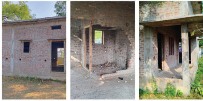
చేయడం వల్ల అంగన్వాడీ కేంద్రం అసాంఘిక తెలిపారు. కార్యక్రమాలకు అడ్డాగా నిలిచింది ఇప్పటికైనా

అసంపూర్తిగా ఉన్న అంగన్వాడీ కేంద్రాన్ని త్వరితగతిన నిర్మాణాలు పూర్తి చేసి ప్రజలకు,చిన్నారు పిల్లలకు అందుబాటులోకి తీసుకురాలని గ్రామ ప్రజలు కోరుతున్నారు.