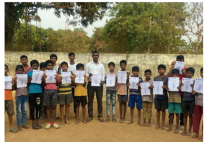
మహానుభావుడు మహాత్మా జ్యోతిబాపూలే కు భారతరత్న బాలుర వసతి గృహ విద్యార్థులు పాల్గొన్నారు.