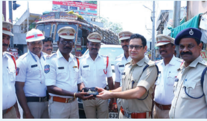
తరంగాలు/ఖమ్మం జిల్లా బ్యూరో ఖమ్మం