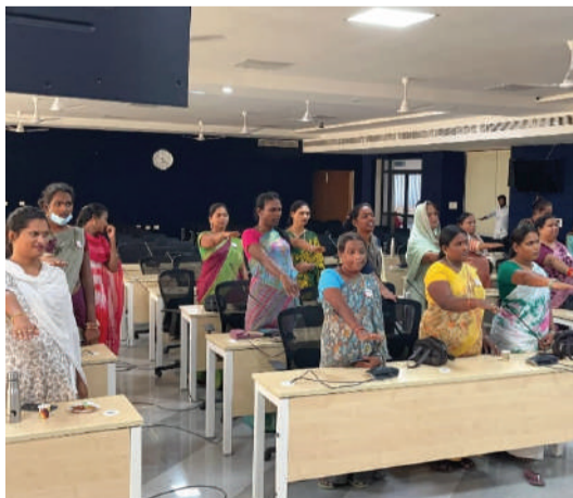
తరంగాలు/ఖమ్మం జిల్లా బ్యూరో ఖమ్మం