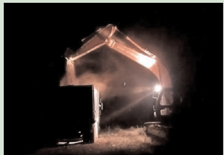
తరంగాలు ప్రతినిధి/సాగూరు వెంకటాపురం

ములుగు జిల్లా వెంకటాపురం మండలం రామచంద్రాపురంలో గ్రావెల్ దండ యదేచ్ఛగా కొనసాగుతుంది, ఇసుక రాంపు నిర్మాణానికి ఆదివాసినలు అనుసంధానం చేసుకొని, కొంతమంది అధికార పార్టీకి చెందిన వ్యక్తులు దబ్బును సొమ్ము చేసుకుంటున్నారు. గతంలో జరిగిన ఇసుక “ దొంగ” విషయం అందరికీ తెలిసిందే, ములుగు జిల్లాకు సంబంధించిన ఎమ్మెల్యే పి.ఎ.పై అనేక ఆరోపణలు ఉన్నాయి అపి.ఎ నే ఈ దండాపై ప్రత్యేక ముగ్గు చూపుతున్న విషయంపై అనేక ఆరోపణలు వెల్లువెత్తుతున్నాయి ఇందులో ములుగు జిల్లాకు సంబంధించిన అధికార పార్టీ నాయకులు, ఒక బడిపంతులు అండదండలు ఉన్నాయని ఆరోపణలు వ్యక్తం అవుతున్నాయి. ఈ విషయంపై అధికారులు పట్టించుకోకపోవడం గమనార్హం, కొంతమంది సీతక్క పేరుతో చలామణి అవుతున్నారని ఆరోపణలు వ్యక్తం అవుతున్నాయి, ఈ విషయంపై జిల్లా స్థాయి అధికారులు ఇప్పటికైనా మొద్దు నిద్ర వీడి తగిన చర్యలు తీసుకోవాలని ఏజెన్సీ ప్రాంత ప్రజలు కోరుకుంటున్నారు..