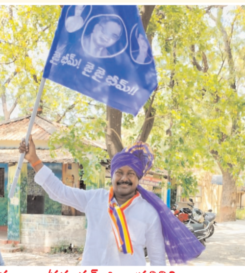
తరంగాలు/వరంగల్ జిల్లా ప్రతినిధి: తెలంగాణ రాష్ట్ర అంబేద్కర్ యువజన సంఘం అధ్యక్షులలో ప్రవచన మేధావి భరతరత్న డాక్టర్