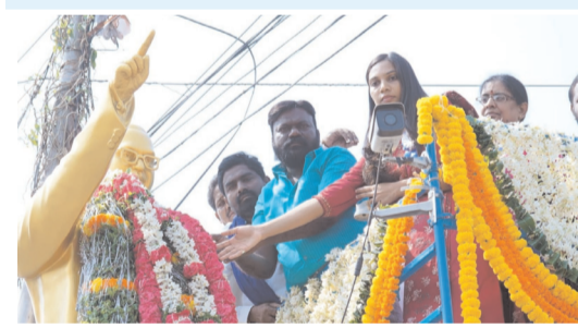
-అంబెద్కర్ జయంతి వేడుకలు -ఊరూరా మారుమ్రోగిని అంబేద్కర్ నామస్మరణం