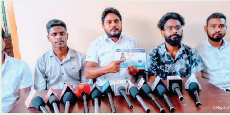
తరంగాలు / పాలకుర్తి