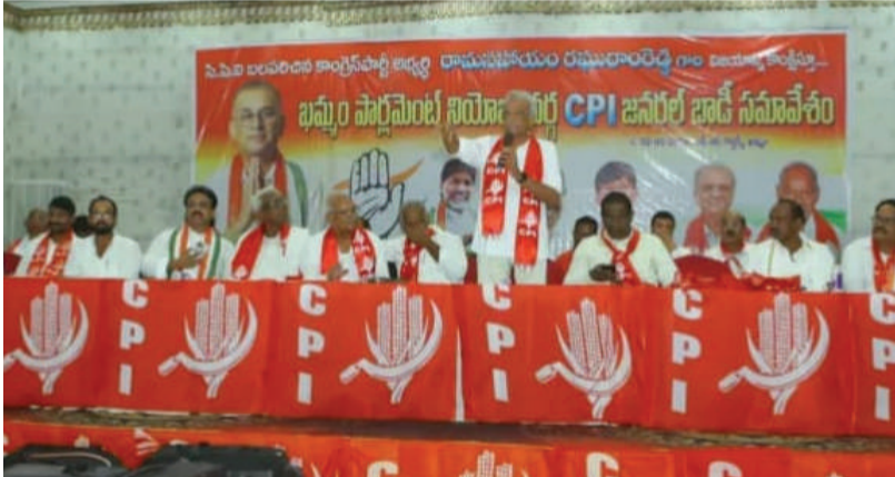
తరంగాలు/ఖమ్మం జిల్లా బ్యూరో ఖమ్మం