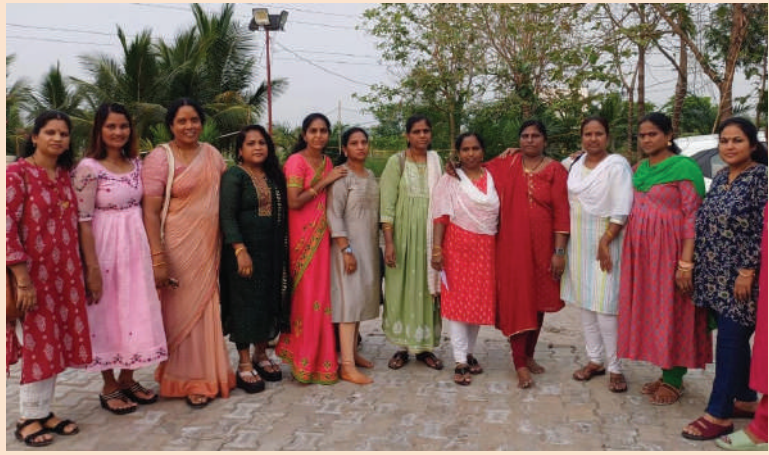
తరంగాలు/ పరంగల్ జిల్లా ప్రతినిధి:

వేసవి సెలవులు రావడంతో గవర్నమెంట్ గర్ల్స్ హై స్కూల్ లమర్ బజార్ 1996-97 బ్యాచ్ కు చెందిన 30మంది పూర్వ విద్యార్థులు తమ తమ పిల్లలతో కలిసి చిన్ననాటి స్నేహితులతో ఓ ప్రైవేట్ హాల్లో ఆత్మీయ సమ్మేళనంలో కలిశారు. ఈ సందర్భంగా తమను తాము మరల వృత్తిపరంగా కుటుంబ పరంగా పరిచయాల చేసుకుంటూనే చిన్ననాటి జ్ఞాపకాలు నెమరు వేసుకున్నామని ఆ మధుర క్షణాలు తిరిగి రానివని ప్రతి ఒక్కరూ పాఠశాల నుండి కాలేజీ దశ వరకు చేసిన ప్రయాణంలో ఎంతోమంది మంచి స్నేహితులుగా మిగిలిపోతారని అటువంటి స్నేహ బంధాన్ని ఎవ్వరు కూడా మరచకూడదని ఈ సందర్భంగా వారు ఒకరి గురించి ఒకరు తెలుసుకుంటూ కుటుంబ విషయాలను పంచుకుంటూ కాసేపు కష్టాలను మంచి ఆటపాటలతో పాటు ఆత్మీయతను పంచుకున్నామని తెలిపారు.