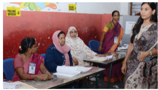
-కిడ్స్ కుమ్ పాఠశాల లో ఏర్పాటు చేసిన పోలింగ్ కేంద్ర సందర్శన...