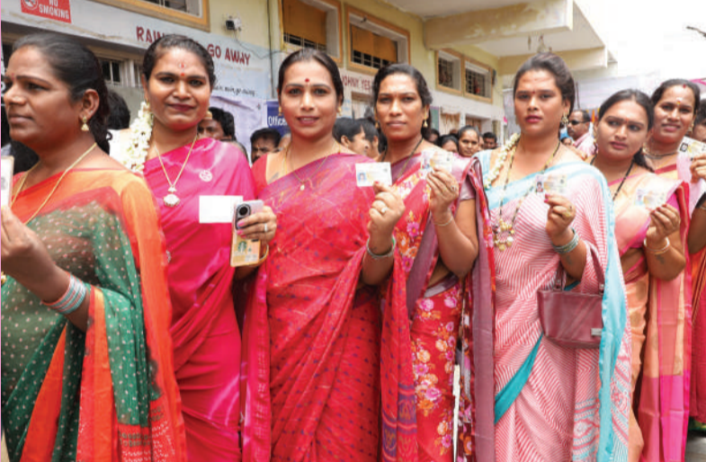
ఎస్ఆర్ఆర్ తోటలోని :111 వాణి విద్యానికేతన్ లో ఓటు హక్కు వినియోగించుకున్న ట్రాన్స్ జెండర్స్..