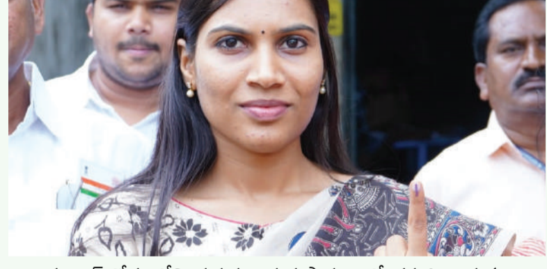
హంటర్ రోడ్డు లోని ప్రభుత్వ ఉన్నత పాఠశాలలో తన ఓటు హక్కు వినియోగించుకున్న వరంగల్ జిల్లా కలెక్టర్ ప్రావీణ్య