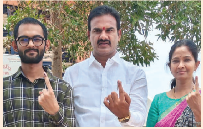
తరంగాలు / మరిపెడ

పార్లమెంట్ ఎన్నికల నేపథ్యంలో భాగంగా సోమవారం రోజున మరిపెడ మండలం సీతారాంపురం కాలనీ ప్రభుత్వ పాఠశాలలో 224 బూత్ నెంబర్ లో తమ ఓటు హక్కును వినియోగించుకున్న ప్రభుత్వ విప్, డోర్నకల్ నియోజకవర్గం ఎమ్మెల్యే డాక్టర్ రామచంద్రనాయక్ దంపతులు