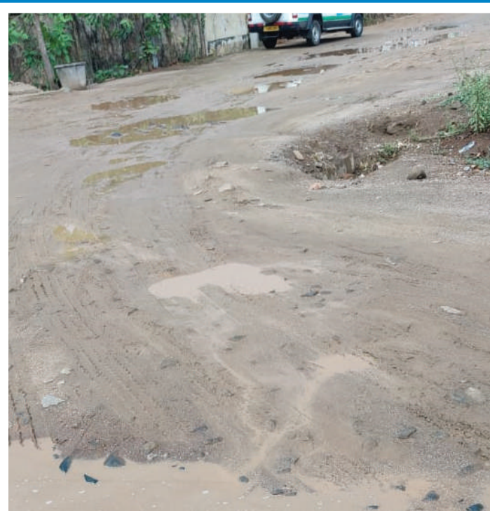
ఏంటి అన్నట్లే రోడ్డును వదిలేసారని ప్రజలు పట్టణ ప్రజలు, రోగులు కోరుతున్నారు.

జగిత్యాల జిల్లా మాత, శిశు దవాఖాన జిల్లాలో పెట్టింది పేరు కానీ వెళ్లే దారి మాత్రం పెద్ద పెద్ద గుంతలు ఒక చిన్న వాన పడితే ఇక అంత సంగతి ఆసుపత్రి రోడ్డు గుంతలతో సరకంగా మారి గర్భిణీ స్త్రీలు, రోగులు ప్రయాణానికి ఇబ్బంది పడుతున్నారు. అమ్మఒడి చేరే ప్రతి ఒక్కరు ఆలోచించవలసిన విషయం నవమాసాలు మోసి కని పెంచే మాతృ మూర్తులు ఎన్ని అవస్థలు పడుతూ మనకు జన్మనిస్తారో ప్రతి మనిషికి తెలుసు కానీ ఈ ప్రభుత్వం ఎందుకు పట్టించుకోవటం లేదని సర్వత్రా నిరసనలు వ్యక్తం అవుతున్నాయి. తల్లులు పడే ఆవేదన పాలకులు అర్థం చేసుకోవటం లేదని అటు కలెక్టరేట్ కి వెళ్లే దారికి సెంట్రల్ లైటింగ్ తోపాటు అన్ని హంగులు ఉన్న రోడ్డు వేసారు, ఎవరో ఎప్పుడో ప్రయాణించే వైద్య కళాశాలకు మంచి రోడ్డు వేస్తారు కానీ నవజాత శిశువులకు జన్మనిచ్చే తల్లులు ఎలా పాతే