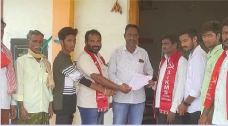
నర్సింహాల పేట /తరంగాలు స్టూన్