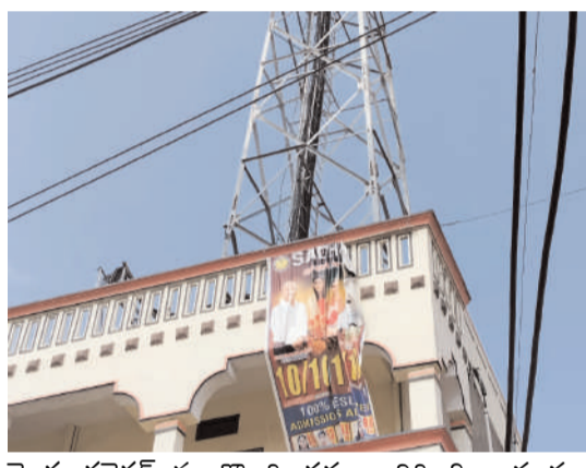
యొక్క కనెక్షన్ ను తొలగించడం జరిగింది. ఇప్పుడు మళ్ళీ వేసవి సెలవుల్లో రాత్రి పూట అక్రమంగా మళ్ళీ

తరంగాలు, ఆలేరు ఆర్పీ : యాదాద్రి భువనగిరి జిల్లా భువనగిరి పట్టణంలోని కోర్టు వెనుక భాగంలో సాధన్ పాఠశాల బిల్డింగ్ పైన సెల్ ఫోన్ టవర్ ను బిగించడం జరిగింది. ఇలానే గతం లోను పాట శాలలో టవర్ ఏర్పాటు చేస్తే స్థానికులు మరియు సాధన్ హై స్కూల్ లో చదివే విద్యార్థుల తల్లిదండ్రులు అప్పటి జిల్లా కలెక్టర్ కు ఫిర్యాదు చేయగా వెంటనే చర్యలు తీసుకొని టవర్