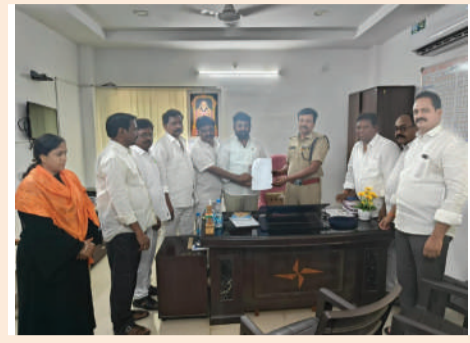
తరంగాలు/ఖమ్మం జిల్లా బ్యూరో ఖమ్మం

-ఖమ్మం ఏ సి పి ని కలిసిన బి ఆర్ ఏస్ పార్టీ నాయకులు