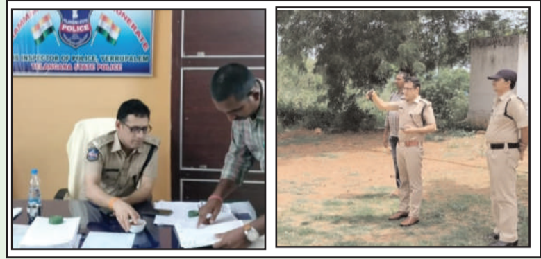
తరంగాలు ఖమ్మం జిల్లా బ్యూరో ఖమ్మం ఎర్రపాలెం మండలం