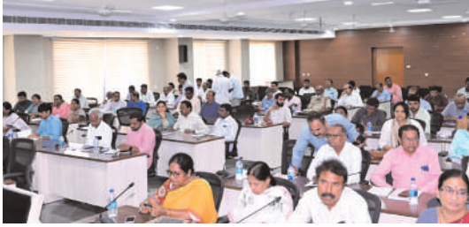
తరంగాలు స్యూస్ -మహబూబాబాద్

-సిఎం కార్యాలయం నుంచి వచ్చిన ప్రజావాణి దరఖాస్తులు వెంటనే పరిష్కరించాలి: -జిల్లా కలెక్టర్ అద్వైత్ కుమార్ సింగ్