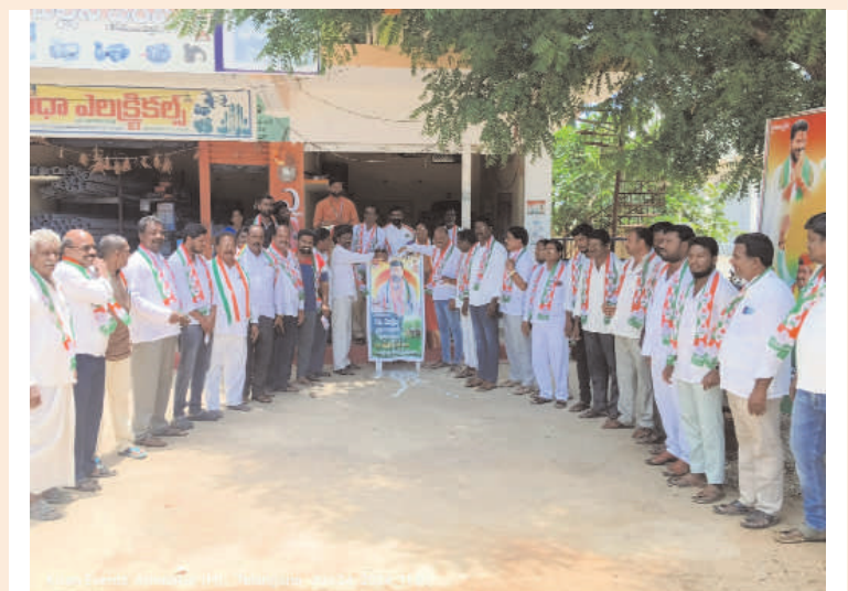
తరంగాలు ఆలేరు ఆర్పీ :

యాదాద్రి భువనగిరి జిల్లా ఆత్మకూరు(ఎం)మండలం కేంద్రంలో సోమవారం రోజు వరంగల్ రైతు డిక్షరేషన్ సమావేశంలో రైతులకు ఏక కాలంలో పంట రుణ మాఫీ చేస్తామని కాంగ్రెస్ పార్టీ ఇచ్చిన హామీ మేరకు సిఎం రేవంత్ రెడ్డి తన సహచర క్యాబినెట్ మంత్రుల సహకారంతో రైతులు ఎప్పుడు ఎప్పుడూ అని ఎదురుచూస్తున్న రైతు రుణ మాఫీ ఏక కాలంలో వచ్చే ఆగస్టు 15 లోపు మాఫీ చేసేందుకు ప్రయత్నాలు మొదలుపెట్టిన ముఖ్యమంత్రి అనుమలు రేవంత్ రెడ్డి చిత్ర పటానికి పాలాభిషేకం చేసిన మండల కాంగ్రెస్ పార్టీ ప్రజా ప్రతినిధులు నాయకులు కార్యకర్తలు.