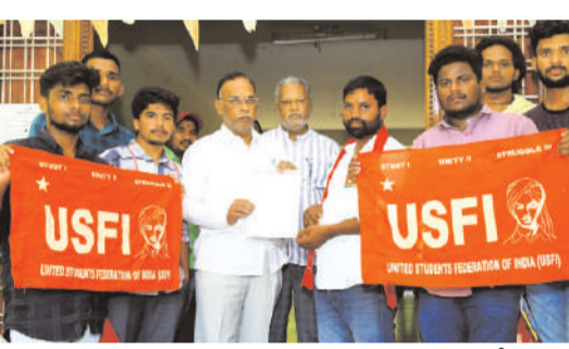
విద్యార్థులు తల్లిదండ్రులు ఆందోళనకు గురవుతున్నారని ఆవేదన వ్యక్తం చేశారు విద్యా సంవత్సరం ప్రారంభమై 14 రోజులు గడుస్తున్న విద్యార్థి కార్యకర్తలు గుర్తింపు పొందిన పాఠశాలలను ప్రకటించకపోవడం వారి నిర్లక్ష్యానికి నిదర్శనం అన్నారు పాఠశాలలో బుక్స్ నోట్స్ యూనిఫామ్స్ తదితర సామాగ్రి అమ్మకూడదని రాష్ట్ర ప్రభుత్వం చెప్పినప్పటికీ యజమాన్యాలు పెడచెవిన్ పెట్టి వేలాది రూపాయలకు అమ్ముతున్న విద్యార్థి కార్యకర్తలు ఒక్క స్కూలుపై చర్యలు తీసుకున్న పాపన్న పోలేదని