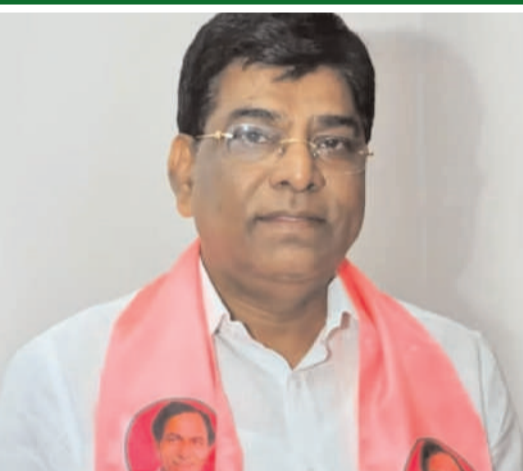
సీజనల్ వ్యాధులు వేగంగా ముసురు తాయని పేర్కొన్నారు. చిన్న పిల్లలు, వృద్ధులు అనే తేడా

-పరిసరాలను పరిశుభ్రంగా ఉంచుకోవాలి -దోమలకు అవకాశం ఇవ్వద్దు -ప్రజలకు ఖమ్మం మాజీ ఎంపీ నామ నాగేశ్వరరావు విజ్ఞప్తి