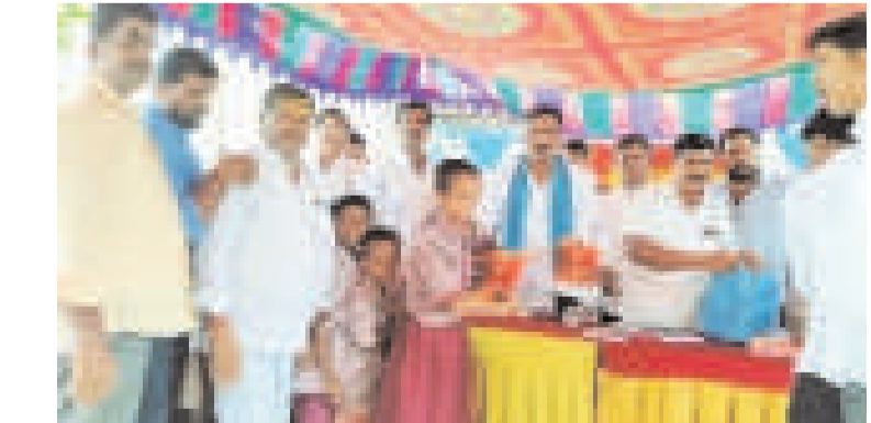
తరంగాలు ,ఆలేరు ఆర్సీ :

యాదాద్రి భువనగిరి జిల్లా రాజాపేట మండలం రఘునాథపురం గ్రామంలో వివేకానంద యువజన సంఘం ఆధ్వర్యంలో ప్రభుత్వ పాఠశాలలో నోట్ బుక్ పంపిణీ కార్యక్రమంలో ప్రభుత్వ విప్ ఆలేరు ఎమ్మెల్యే బీర్ల ఐలయ్య ముఖ్యఅతిథిగా హాజరయ్యారు. ఈ కార్యక్రమంలో 200 మంది విద్యార్థులకు నోట్ బుక్ ను ఆలేరు ఎమ్మెల్యే ప్రభుత్వ విప్ బీర్ల ఐలయ్య చేతుల మీదుగా విద్యార్థులకు పంపిణీ చేయడం జరిగింది.