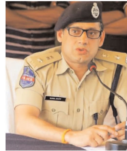
లెక్కింపు కేంద్రానికి 200 మీటర్ల లోపు ఐదుగురు కంటే ఎక్కువ మంది వ్యక్తులు గుమికూడటం