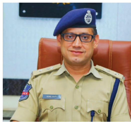
వ్యక్తి స్నేహంగా ఉంటూ.. ఇప్పుడు అడిగిన డబ్బులు ఇవ్వకపోతే ఫోటోలు, వీడియోలు సోషల్ మీడియాలో పెడతానంటూ.. బ్లాక్ మెయిల్ చేయడంతో సడరు