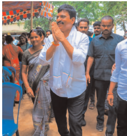
నేరవేరుస్తామని స్పష్టం చేశారు. ఏడాదిలోపు పాల్గొనే అన్ని గ్రామాల్లో సీసీరోడ్లు పూర్తి చేస్తామని తెలిపారు. రూ.22.5 కోట్ల వ్యయంతో ఇందిరమ్మ ఇళ్లు నిర్మిస్తామని తెలిపారు. రాష్ట్రంలో ప్రజాప్రభుత్వం

తరంగాలు/భువ్వం జిల్లా బ్యారో ఖమ్మం నేలకొండపల్లి అసెంబ్లీ పార్లమెంటు ఎన్నికల్లో భాగంగా ఇచ్చిన ప్రతి హామీని నెరవేరుస్తామని మంత్రి పొంగులేటి శ్రీనివాస రెడ్డి భరోసా ఇచ్చారు. నేలకొండపల్లి మండలంలో సోమవారం పర్యటించారు. పర్యటనలో భాగంగా కొత్తకొత్తూరు, మంగాపురం తండా, రాయగూడెం, అప్పలనరసింహాపురం, కొంగర, కట్టుకాచారం, బుద్దారం, చెరువుమదారం, రాజారాంపేట, అజయ్ తండా, ఖైరపునిపల్లి, తిరుమలపురం, పైనంపల్లి, రామచంద్రాపురం, సురేపల్లి, పాత కొత్తూరు, చెన్నారం గ్రామాల్లో పర్యటించారు. ప్రజల నుంచి వినతులను స్వీకరించారు. అనంతరం అక్కడ ఏర్పాటు చేసిన సమావేశాల్లో మంత్రి మాట్లాడుతూ.. ఎన్నికల వేళ ఇచ్చిన మాట ప్రకారం న్యాయమైన కోరికలు అన్నీ .. నిర్మిస్తామని తెలిపారు. రాష్ట్రంలో ప్రజాప్రభుత్వం