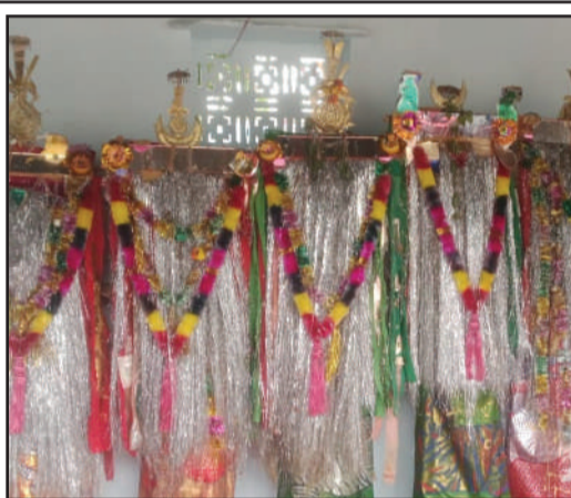
మొహరం(పీర్ల పండుగ) విశిష్టత.