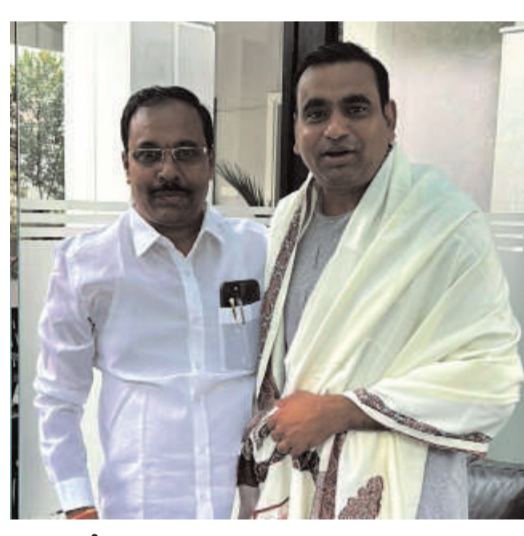
చెల్లించలేక యాజమాన్యం వారు చాలా ఇబ్బందులు ఎదుర్కొంటున్నారని వివరించారు . మీ ద్వారా మా