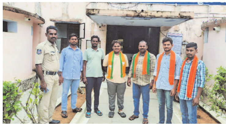
నిరుద్యోగులకు ఇచ్చిన హామీల మీద లేకపోగా అరెస్టులు చేయడం సిగ్గుచేటు. ఆదివారం రోజు సీఎం రేవంత్ రెడ్డి అబ్బిలాపూర్ మేట్ పర్యటన సందర్భంగా

తరంగాలు ,ఆలేరు ఆర్పీ : ప్రభుత్వం ఏర్పడి 200 రోజుల అయినప్పటికీ ఎలాంటి హామీల నెరవేర్చలేని ఈ అసమర్థ ప్రభుత్వం, ఎక్కడ పర్యటించాలన్న భయంతో ముందస్తు అరెస్టులు చేసి పర్యటించే దౌర్భాగ్య స్థితిలో కాంగ్రెస్ ప్రభుత్వం ఉందని రాష్ట్ర బీజేవైఎం యువ మోర్చా అంటేనే రేవంత్ రెడ్డికి వెన్నులో వణుకు వస్తుంది అందుకే బీజేవైఎం రాష్ట్ర యువమోర్చా ఎలాంటి పిలుపునిచ్చిన ముందుగానే అరెస్టులు చేస్తున్నారు. వేరే పార్టీలో గెలిచిన ఎమ్మెల్యేలను కొనుక్కోవడం మీద ఉన్న శ్రద్ధ