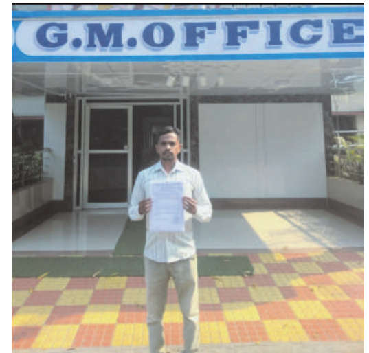
దరఖాస్తు చేశారు, దీనికి గాను సంబంధిత అధికారులు స్పందిస్తూ సింగరేణి జిఎం ఆఫీస్ పిఐఓలు ప్రజా ప్రయోజనం లేనిది సమాచార హక్కుల చట్టం సెక్షన్