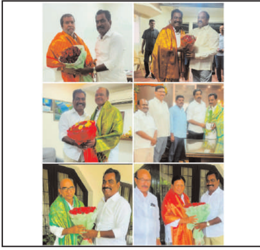
రెడ్డిహైదరాబాద్ బషీరాబాద్ లోని రాష్ట్ర ఆయిల్ ఫెడ్ కార్పొరేషన్ ఆఫీస్ లో చైర్మన్ గా ప్రమాణ స్వీకారం