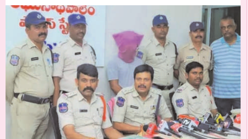
తరంగాలు/ఖమ్మం జిల్లా బ్యూరో