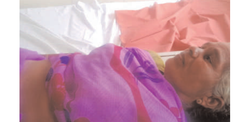
తరంగాలు ప్రతినిధి/ భువనగిరి నియోజకవర్గం