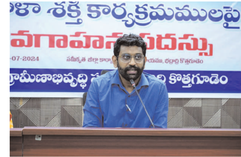
-జిల్లా కలెక్టర్ జితేష్ వి. పాటిల్.