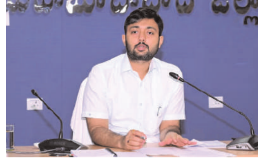
వర్షాల నేపథ్యంలో జిల్లా కమాండ్ కంట్రోల్ రూమ్ ను ప్రతి ఒక్కరూ సందర్శించుకోవాలని