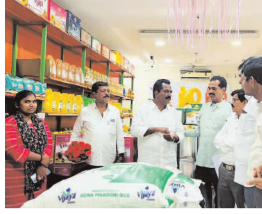
కేంద్రంలో కార్పొరేషన్ అధ్యక్షులలో విజయ వంట సూనెలు, నన్ షవర్, వేరు శనగ, రైస్ బ్రాన్, దీపం ఆయిల్ ఉత్పత్తులను సూపర్ మార్కెట్లను ఏర్పాటు చేసి విజయ ఉత్పత్తులను మార్కెట్ చేయాల్సిన అవసరం ఉందన్నారు. ఆయిల్ ఫామ్ కు అనుబంధం గా మార్కెట్ లో విస్తరించినపుడే రైతు కు లాభం ఉంటుందన్నారు. మార్కెట్లో నాణ్యతకు మారుపేరుగా