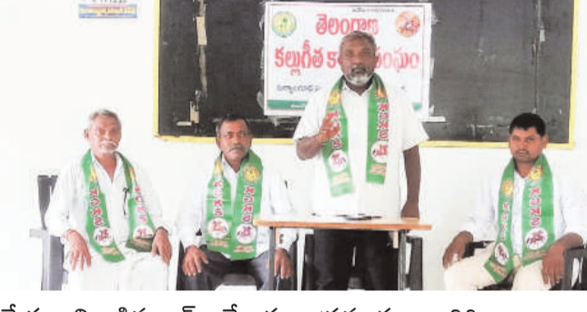
చేయాలని డిమాండ్ చేశారు. ప్రమాదం జరిగి వందలాదిమంది కాళ్లు చేతులు విరగడం, నడుము పడిపోవడం, చనిపోవడం జరుగుతుండన్నారు. రియల్ ఎస్టేట్ వ్యాపారులతో భూములకు ధరలు పెరగడంతో తాటి ఈత చెట్లను సరికి వేస్తున్నారని, రోజు రోజుకు వనాలు తరిగిపోతున్నాయన్నారు. లిక్కర్ బెల్టు షాపుల వలన కల్లు అమ్మకాలు పడిపోతున్నాయని చెప్పారు. 1991 వ సంవత్సరంలో కాంగ్రెస్ ప్రభుత్వ హయాంలో కల్లుగీత కార్మికుల సంక్షేమం కోసం కల్లుగీత పారిశ్రామిక ఆర్థిక సంస్థ ఏర్పాటు అయిందన్నారు. గీత కార్మికులకు రుణాలు ఇవ్వడం మేరా తాటి ఉత్పత్తుల శిక్షణ కేంద్రం ఏర్పాటు