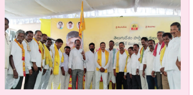
తరంగాలు ,ఆలేరు ఆర్సీ :