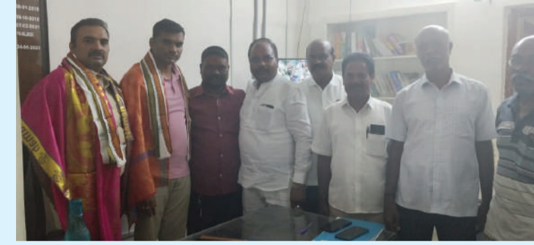
తరంగాలు, ఆలేరు ఆర్సీ :

సూతనంగా బాధ్యతలు చేపట్టిన ఎస్సెక్ కి సన్మానం కాంగ్రెస్ నాయకులు