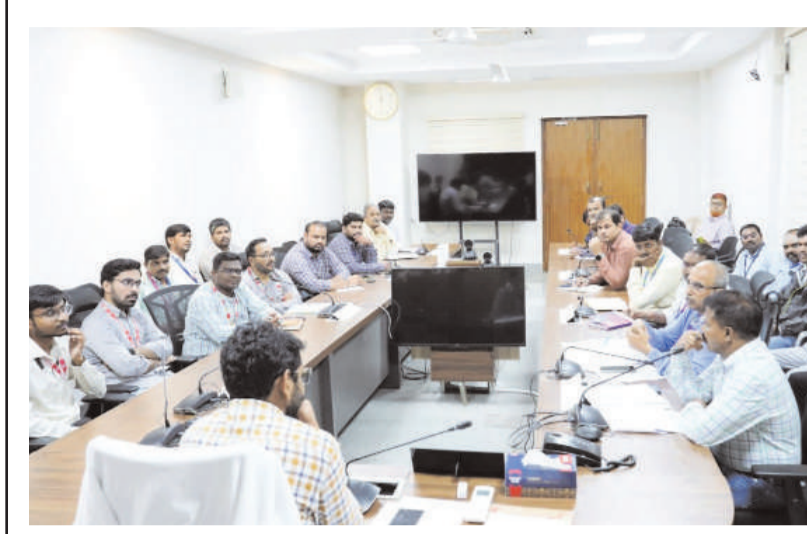
తరంగాలు /భద్రాద్రి ప్రతినిధి

రాష్ట్ర ప్రభుత్వం ప్రతిష్టాత్మకంగా నిర్వహిస్తున్న రైతు రుణమాఫీ పథకం జిల్లాలో అమలుపై అన్ని బ్యాంకుల అధికారులతో గురువారం ఐ డి ఓ సి కార్యాలయం సమావేశ మందిరంలో జిల్లా కలెక్టర్ జితేష్ వి. పాటిల్ సమీక్ష సమావేశం నిర్వహించారు. ఈ సందర్భంగా కలెక్టర్ మాట్లాడుతూ జిల్లా లోని ఐదు నియోజకవర్గాల్లో లక్ష రూపాయలు లోపు రుణాల మాఫీ క్రింద 28018 మంది లబ్ధిదారులను గుర్తించినట్లు తెలిపారు. ఈరోజు గుర్తించిన లబ్ధిదారులందరికీ తమ యొక్క బ్యాంక్ అకౌంట్లో రుణమాఫీ డబ్బులు జమవుతాయని ఆయన తెలిపారు. ఈ సందర్భంగా అన్ని బ్యాంకుల అధికారులు రుణమాఫీ డబ్బులను రైతులకు అందించాలని మరో