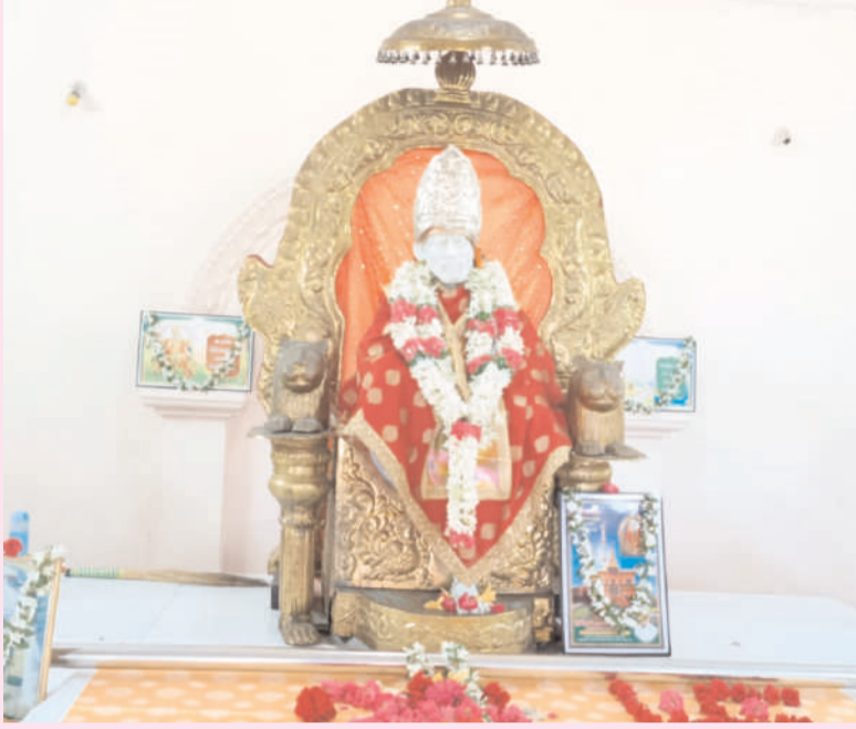
రాయపర్తి మండలం తరంగాలు/