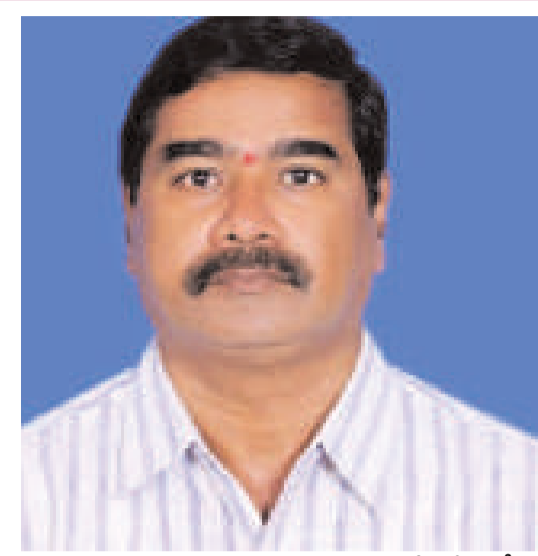
జూన్ 2024న పూర్తి కావడిన సెకండరీ గ్రేడ్ టీచర్