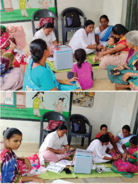
తరంగాలు ,ఆలేరు ఆర్పీ :

-అంగన్నాడీ కేంద్రంలో టీకాలు వేసిన ఏఎన్ఎం మమత