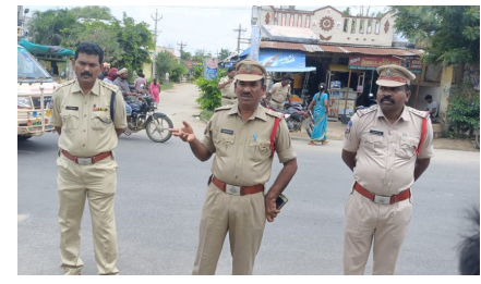
అమూల్యమైన జీవితాలను కోల్పోవద్దీ

వస్తున్నదని, ప్రమాదాల బారిన పడకుండా ప్రతి ఒక్కరూ రోడ్డు భద్రతా నియమాలను పాటించాలన్నారు. ఇటీవల జరుగుతున్న రోడ్డు ప్రమాదాలలో హెల్మెట్ పెట్టుకోకపోవడం వల్లే తలకు తీవ్ర గాయాలై మృతి చేసినట్లు తెలిపారు. మద్యం మత్తులో డ్రైవింగ్, రాంగ్ రూట్లో డ్రైవింగ్, శ్రీపుల్ రైడింగ్, హెల్మెట్ లేకుండా వంటి నిర్లక్ష్యపు డ్రైవింగ్ చేయొద్దని, జాగ్రత్తగా డ్రైవ్ చేయాలని సూచించారు. ముఖ్యంగా గంజాయి, డ్రగ్స్ పై ప్రత్యేక నిఘా పెట్టినట్లు తెలిపారు. వర్తన్పేట ఎస్సై ప్రవీణ్ కుమార్, పోలీస్ సిబ్బంది