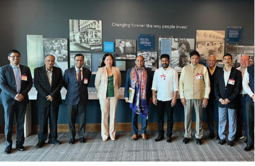
తరంగాలు-హైదరాబాద్, ముఖ్యమంత్రి రేవంత్ రెడ్డి తెలంగాణకు పెట్టుబడులు రాబట్టడమే లక్ష్యంగా అమెరికాలో వివిధ బహుళజాతి సంస్థలతో సంప్రదింపులు జరుపుతున్నారు. పరిశ్రమల స్థాపన ద్వారా ఇక్కడి యువతకు ఉద్యోగ, ఉపాధి అవకాశాలు కల్పించాలనే సంకల్పంతో ఈ నెల 3న అమెరికా వెళ్లిన సీఎం ఇప్పటి వరకు ఐదు రోజుల వ్యవధిలో 10 సంస్థలతో ఒప్పందాలు చేసుకున్నారు. -మిగతా 2 లో