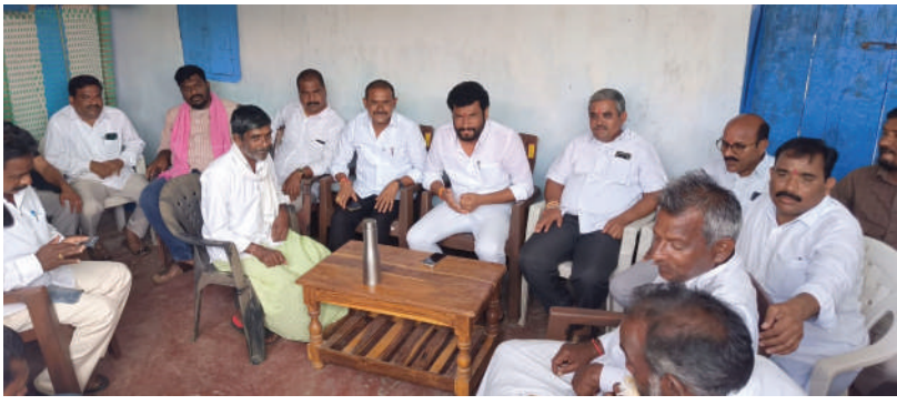
-ఈ ప్రభుత్వనియంత పాలనకు నిదర్శనం -బోఫ్ ఎమ్మెల్యే శ్రీ అనిల్ జాదవ్

ఆదిలాబాద్ బ్యూరో తరంగాలు తమకు రుణమాఫీ లభించలే దని, తమకు కూడా న్యాయం చేయాలని డిమాండ్ చేస్తూ రై తులు ఆందోళన చేపట్టడంతో పోలీసులు కేసులు నమోదు చే శారు. దీంతో బోఫ్ ఎమ్మెల్యే అనిల్ జాదవ్ తీవ్ర ఆగ్రహం వ్య క్తం చేశారు. రుయ్యడి గ్రామ రై తుల మీద అక్రమ కేసులు పెట్ట డం కాదు ఈ ప్రభుత్వానికి సో యి ఉంటే, ఈ ప్రభుత్వానికి రై తుల మీద ప్రేమ