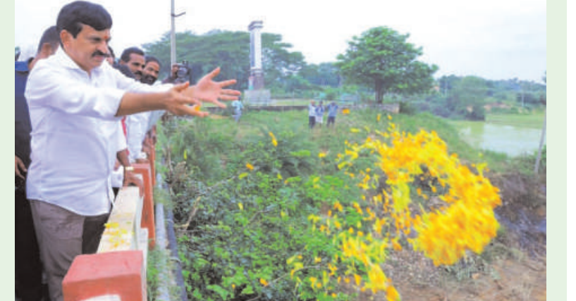
తరంగాలు/ఖమ్మం జిల్లా బ్యూరో ఖమ్మం :