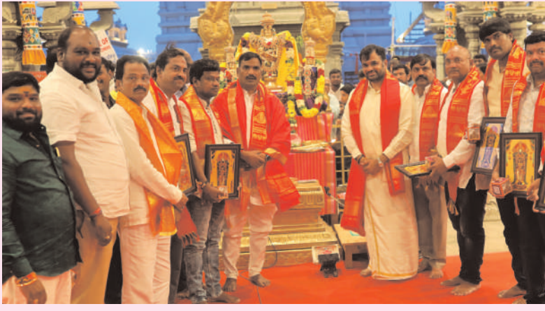
తరంగాలు, ఆలేరు ఆర్పీ :