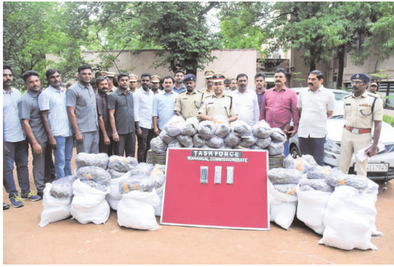
-గంజాయి తరలిస్తున్న స్వగర్లు అరెస్టు.. -256 కిలోల గంజాయి తో పాటు రెండు కార్లు, మూడు సెల్ ఫోన్లను స్వాధీనం చేసుకున్న టాస్క్ ఫోర్స్, నర్సంపేట పోలీసులు