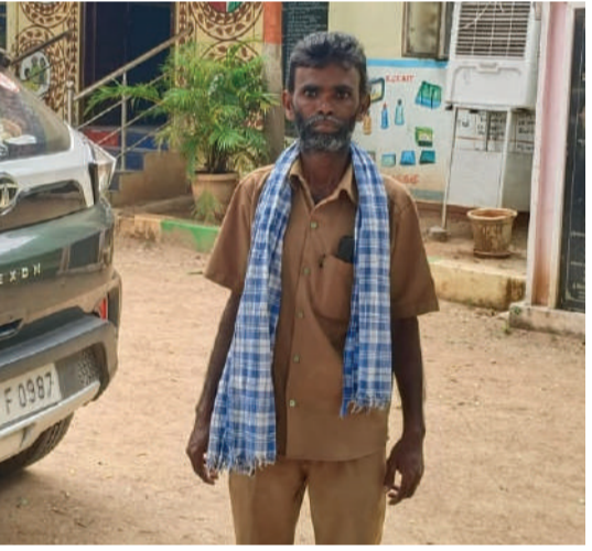
చేశాయి... గ్రామపంచాయతీ పనులలో భాగంగా గ్రామంలోని సైడ్ కాలువలు శుభ్రం చేస్తుండగా వెనుక నుండి వీధి కుక్కలు ఒక్కసారిగా మీద పడి తొడపై

-వీధి కుక్కలను చూసి భయభ్రాంతులకు గురవుతున్న చిన్నపిల్లలు ఆడవారు వృద్ధులు... -వీధి కుక్కల దాడులు ఎన్ని జరిగినా పట్టించుకోని సంబంధిత అధికారులు... -కుక్కల దాడి నుంచి ప్రజలను కాపాడేది ఎవరు...?