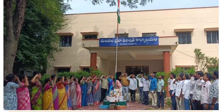
మండల పరిషత్ కార్యాలయంలో...