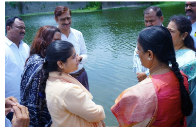
మహాత్మ్యంలో భాగంగా వరంగల్ కోటలో పెద్ద ఎత్తున మొక్కలు నాటేలా చర్యలు