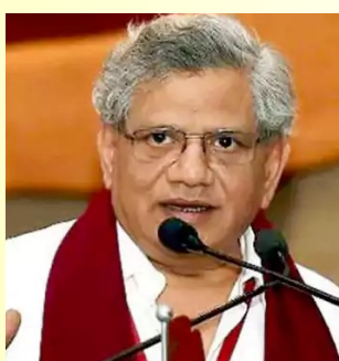
ఢిల్లీలోని ఎయిమ్స్ మెడికల్ కాలేజీకి కుటుంబ సభ్యులు దానం చేయనున్నారు .మెడికల్ కాలేజీకి

రాజకీయ నేత, సీపీఎం అగ్రనేత సీతారాం ఏచూరికి అంత్యక్రియలు నిర్వహించరని పార్టీ తెలిపింది. ఆయన భౌతిక కాయం వద్ద నివాళి అర్పించిన తరువాత బాడీని ఎయిమ్స్ కు అందజేస్తారు. ఆయనకు అంత్యక్రియలు నిర్వహించటం లేదని కుటుంబ సభ్యులు కూడా తెలిపారు. ఆయన బతికి ఉన్నప్పుడే.. తాను చనిపోతే.. తన పార్టీవదేహాన్ని వైద్య పరీక్షల కోసం.. వైద్య విద్యార్థుల రీసెర్చ్ కోసం ఉపయోగించుకోవాలని నిర్ణయించారు. అందుకు తగ్గట్టుగానే ఇప్పుడు ఆయన పార్టీవదేహాన్ని