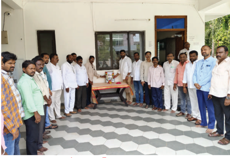
తరంగాలు ప్రతినిధి/ వరంగల్: