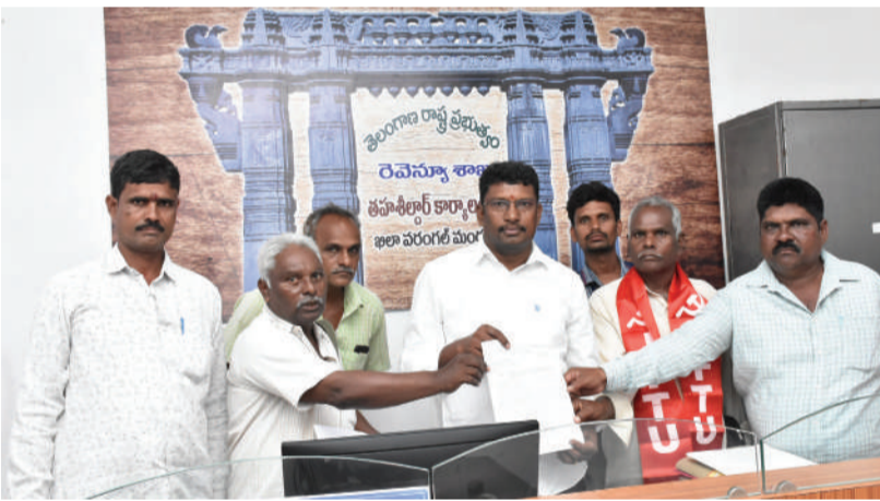
-ఎమ్మార్సీ కు వినతి పత్రం అందజేసిన భవన నిర్మాణ కార్మిక సంఘాల జేవీసీ...

తరంగాలు ప్రతినిధి/ వరంగల్: అద్వైజరీ బోర్డుల ద్వారా సంక్షేమ పథకాలను అమలు చేయాలని భవన నిర్మాణ కార్మిక సంఘాల జేవీసీ ఆధ్వర్యంలో ఖిలా వరంగల్ ఎమ్మార్సీకి వినతి పత్రం అందజేశారు.భవన నిర్మాణ కార్మికుల హక్కులను హరించి వేస్తూ రాష్ట్ర ప్రభుత్వాల ఆధీనంలో ఉన్న