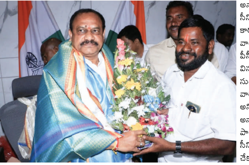
యువ నాయకులకు పార్టీ పునర్నిర్మాణంలో కీలక పాత్ర ఉంటుందని నేను నమ్ముతున్నాను," అని అంశాలు ప్రాధాన్యం సంతరించుకున్నాయి.