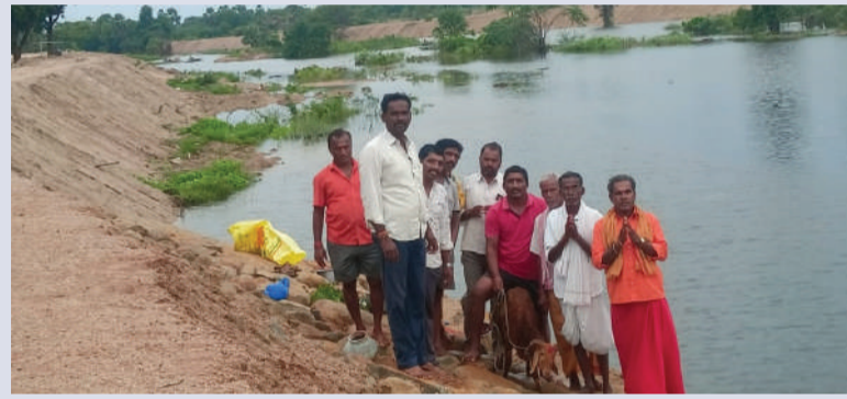
తరంగాలు న్యూస్ ,ఆలేరు ఆర్పీ :