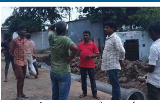
కురుమూర్తి స్వామి కొండకు వెళ్లే దారి ఇదే కావున