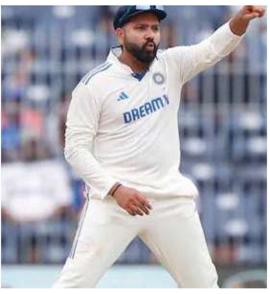
2023-25 సైకిల్లో 1000 పరుగులు చేసిన తొలి భారత బ్యాటర్గా హిట్ మ్యాన్ నిలుస్తాడు. ప్రస్తుతం రోహిత్ శర్మ 742 పరుగులతో ఉన్నాడు. డబ్ల్యూటీసీలో రెండు సార్లు 1000కిపైగా పరుగులు చేసిన తొలి భారత బ్యాటర్గా కూడా రికార్డ్ అందుకుంటాడు.

సొంతగడ్డపై బంగ్లాదేశ్తో రెండు టెస్టుల సిరీస్ను క్లీన్ స్వీప్ చేసిన టీమిండియా.. మరో ఆసక్తికర పోరుకు సన్నద్ధమైంది. న్యూజిలాండ్తో బుధవారం(అక్టోబర్) నుంచి ప్రారంభం కానున్న మూడు టెస్టుల సిరీస్లో అమీతుమీ తేల్చుకోనుంది. బెంగళూరు వేదికగా జరిగే తొలి టెస్టులో ఈ సిరీస్కు తెరలేపనుంది. వర్షం కారణంగా ఈ మ్యాచ్ అంతరాయం ఏర్పడింది. భారీ వర్షంతో ఇంకా మ్యాచ్ ప్రారంభం కాలేదు. మరోవైపు ఈ సిరీస్ గెలిచి వరల్డ్ టెస్ట్ ఛాంపియన్షిప్(డబ్ల్యూటీసీ) ఫైనల్ బెర్లెస్ ఖరారు చేసుకోవడంతో పాటు సొంతగడ్డపై తమ జైత్రయాత్రను కొనసాగించాలని టీమిండియా భావిస్తోంది. సొంతగడ్డపై భారత్ ఇప్పటి వరకు వరుసగా 17 టెస్టు సిరీస్లు గెలిచింది. 18వ సిరీస్ విజయంపై కన్నెసింది. ఇక ఈ సిరీస్ ప్రారంభానికి ముందు టీమిండియా కెప్టెన్ రోహిత్ శర్మను ఓ ఆరుదైన ఘనత ఊరిస్తోంది. ఈ మూడు టెస్టుల సిరీస్లో రోహిత్.. 258 పరుగులు చేస్తే.. డబ్ల్యూటీసీ భారత బ్యాటర్గా కూడా రికార్డ్ అందుకుంటాడు.