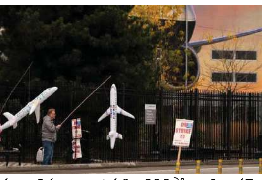
పలు విమానాల ఉత్పత్తి నిలిచిపోయింది. సమ్మె కారణంగా 2025లో డెలివరీ చేయాల్సిన 777 ఎక్స్

ప్రముఖ విమానాల తయారీ సంస్థ బోయింగ్ ఫాకింగ్ నిర్ణయం తీసుకుంది. సంస్థలోని మొత్తం ఉద్యోగుల్లో దాదాపు 10 శాతం మంది అంటే సుమారు 17 వేల మంది ఉద్యోగులపై వేటుకు రెడీ అయింది. ఈ విషయాన్ని సంస్థ సీఈవో కెల్వి ఓర్ట్లెర్ ఈ-మెయిల్ ద్వారా ఉద్యోగులకు తెలియజేశారు. కంపెనీ తీవ్రమైన ఆర్థిక కష్టాలను ఎదుర్కొంటున్న నేపథ్యంలో ఈ నిర్ణయం తీసుకున్నట్లు తెలిసింది. సియాటిల్ ప్రాంతంలో ఆ సంస్థకు చెందిన 33 వేల మంది కార్మికులు నెల రోజులుగా సమ్మె చేస్తున్నారు. దాంతో