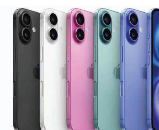
ఆపిల్ ఐ-ఫోన్ 16 ఫోన్ల విక్రయాలకు తమ శాఖ విరుద్ధం అని ఆయన స్పష్టం చేశారు. చట్ట విరుద్ధంగా ఐ-ఫోన్ 16 ఫోన్లను వారు తమకు వారి సమాచారాన్ని ప్రభుత్వానికి తెలియజేయాలని ప్రజలను కోరారు.

ఆపిల్ ఐ-ఫోన్ అంటే ప్రతి ఒక్కరికీ క్రేజీ.. కానీ ఇండోనేషియా మాత్రం ఆపిల్ ఐ-ఫోన్లను నిషేధించింది. గత నెలలో గ్లోబల్ మార్కెట్లలో అవిష్కరించిన ఐ-ఫోన్ 16 సిరీస్ ఫోన్లు ఇండోనేషియా సరిహద్దులోపల కనిపిస్తే చట్ట విరుద్ధం అని ఆ దేశ పరిశ్రమలశాఖ మంత్రి అగస్ గుమీవాంగ్ కర్డాసామిత్ ప్రకటించారు. విదేశాల నుంచి ఐ-ఫోన్ 16 ఫోన్లు కొనుగోలు చేయొద్దని యూజర్లను హెచ్చరించారు. ఇండోనేషియాలో పెట్టుబడులు పెడతామని ఇచ్చిన హామీలను ఆపిల్ నిలబెట్టుకోవడం వల్లే ఆపిల్ ఐ-ఫోన్ 16 ఫోన్లపై నిషేధం విధించినట్లు తెలుస్తోంది. ఇండోనేషియాలో 95 మిలియన్ డాలర్ల పెట్టుబడులు పెడతామని ఆపిల్ హామీ ఇచ్చింది. కానీ ఆచరణలో 14.75 మిలియన్ డాలర్లకు మాత్రమే పరిమితమైంది. ఈ పరిస్థితుల్లో