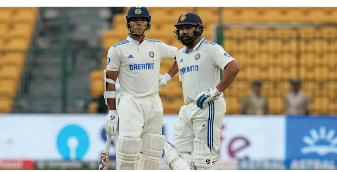
నాటౌట్) దూకుడుగా ఆడాడు. ఒకే ఓవర్ లో రెండు ఫోర్లు, ఓ సిక్స్ కొట్టడంతో భారత్ స్కోరు 150 దాటేసింది. లేదంటే పరిస్థితి మరింత దారుణంగా ఉండేది. మిచెల్ శాంట్లర్ (7/53), గైస్ ఫిలిప్పస్ (2/26) స్పిన్ దెబ్బకు భారత్ విలలడింది. రోహిత్ శర్మ (0), జస్ప్రిత్ బుధ్రా (0) డకౌట్ అయ్యారు. విరాట్ కోహ్లి

బెంగళూరు టెస్టులో తడబడిన రోహిత్ సేన టీమిండియా ఆటతీరు మారలేదు. న్యూజిలాండ్ తో బెంగళూరు టెస్టులో తడబడిన రోహిత్ సేన.. పూజే టెస్టులోనూ పేలవ ఆట తీరును ప్రదర్శించింది. పూజే తొలి ఇన్నింగ్స్ లో 156 పరుగులకే ఆటౌట్ అయ్యింది. స్పిన్ కు అనుకూలమైన పిచ్ పై కివీస్ స్పిన్ నెట్ మెంట్ శాంట్లర్.. భారత బ్యాట్లను ముప్పు తీసుకుపోతున్నాయి. ఏడు వికెట్లతో చెలరేగి.. ఇండియన్ బ్యాటింగ్ లైన్ప్ ము దెబ్బకొట్టాడు. రవీంద్ర జడేజా (38) టాప్ స్కోరర్. న్యూజిలాండ్ 103 పరుగుల తొలి ఇన్నింగ్స్ లీడ్ సాధించింది. కివీస్ తొలి ఇన్నింగ్స్ లో 259 పరుగులు చేసింది. 16/1 స్కోరుతో రెండో రోజు ఆటను ప్రారంభించిన భారత్ తొలి సెషన్ లోనే ఆరు వికెట్లు కోల్పోయి కష్టాల్లో పడింది. లంఛన్ అనంతరం కూడా పరిస్థితి మారలేదు. స్వల్ప వ్యవధిలోనే మిగిలిన వికెట్లను కోల్పోయింది. రవీంద్ర జడేజా (38), యశస్వి జైస్వాల (30), శుభేష్ గిల్ (30) మాత్రమే ఫర్వాలేదనిపించారు. చివర్లో వాషింగ్ డన్ సుందర్ (18