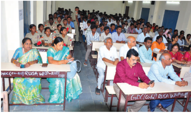
-ముఖ్య అతిథులుగా హాజరైన రావుల మరియు రాచాల