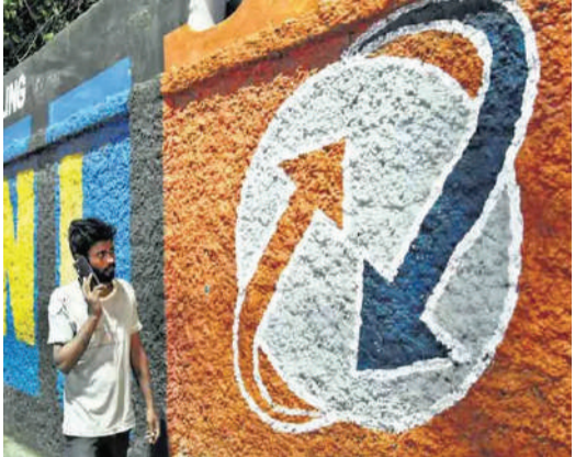
సబ్స్క్రిబర్లను పెంచుకున్న బీఎస్ఎన్ఎల్, గత ఆగస్టు నెలలో 7.84 శాతం వాటా పెంచుకోవడం గమనార్హం. ఆగస్టులో బీఎస్ఎన్ఎల్ ఎంచుకున్న సబ్స్క్రిబర్ల సంఖ్య 25 లక్షలు పెరిగితే, అంతకుముందు

సాంకేతిక ఎన్నికల ఫలితాలు వెలువడిన తర్వాత గత జూలైలో ప్రముఖ ప్రైవేట్ టెలికం కంపెనీలు ప్రీపెయిడ్, పోస్ట్ పెయిడ్ రీచార్జీలు దాదాపు 25 శాతం పెంచేశాయి. దీంతో ప్రైవేట్ మొబైల్ ఫోన్ యూజర్లు, సదరు ప్రైవేట్ టెలికం కంపెనీలకు రాంరాం చెప్పి ప్రభుత్వ రంగ టెలికం సంస్థ భారత్ సంచార్ నిగమ్ లిమిటెడ్ (బీఎస్ఎన్ఎల్)కు కలిసి వచ్చింది. భారీగా ప్రీ పెయిడ్ చార్జీలు పెంచిన ప్రైవేట్ టెలికం సంస్థలు ప్రతి నెలా సబ్స్క్రిబర్లు భారీగా కోల్పోతుండగా, బీఎస్ఎన్ఎల్ మాత్రం స్వూప సబ్స్క్రిబర్లను చేర్చుకోవడంలో ముందు వరుసలో నిలిచింది. జూలైలో మార్కెట్ వాల్యూ 7.59 శాతం